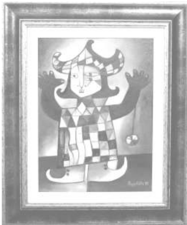
Festményeimet nemsokára megjelenő honlapon lehet megtekinteni.

Magántanárként folytattam, olyan gyermekekkel dolgoztam, akik fejlettebb szinten szerették volna elsajátítani a rajzolást és festést.