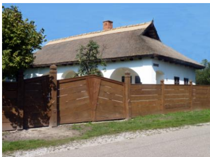
A múzeum épülete